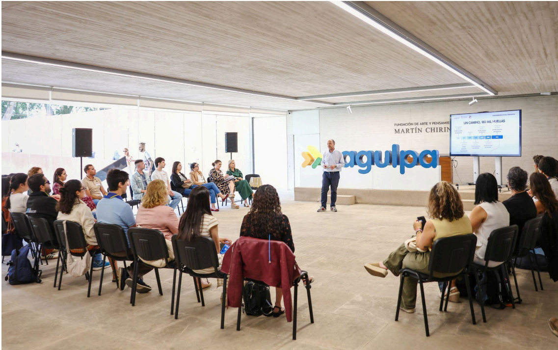
Encuentro de las asociaciones en la Fundación Martín Chirino -Mayo 2025