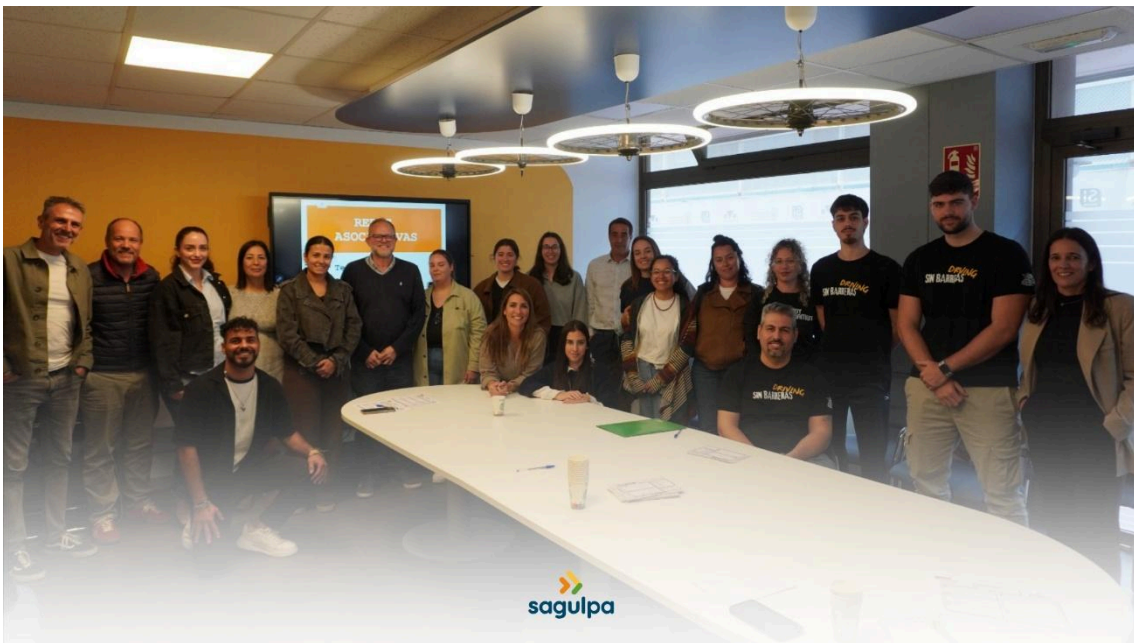
2º Encuentro "Tejiendo Alianzas Estratégicas" en la Sede de Sagulpa