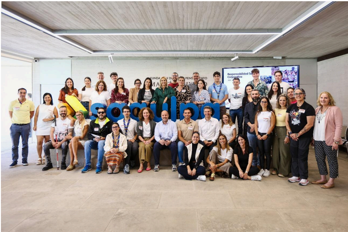
Encuentro de las asociaciones en la Fundación Martín Chirino -Mayo 2025