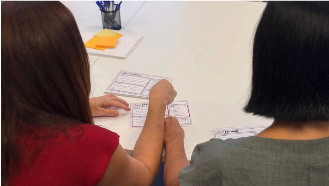
1º Encuentro "Tejiendo Alianzas Estratégicas" en la Sede de Sagulpa